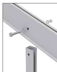
Detail spojení nohy a krokve