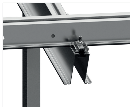
Detail spojení krokve a nosníku panelu