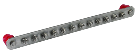
Zobrazení je nezávazné