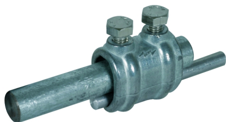
Zobrazení je nezávazné