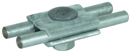
Zobrazení je nezávazné