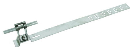
Zobrazení je nezávazné