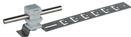
Zobrazení je nezávazné